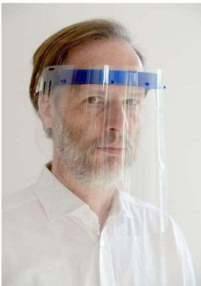
Das von cirp und Fazua in Rekordzeit produzierte Gesichtvisier zeichnet sich durch seine Stabilität, Wiederverwendbarkeit und seinen Tragekomfort aus